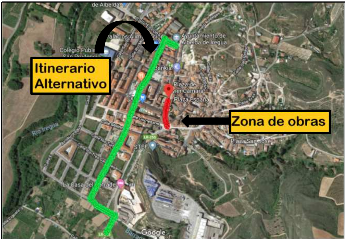
VISTA AÉREA del ITINERARIO ALTERNATIVO para el CORTE de TRÁFICO Calle SANTA ISABEL.